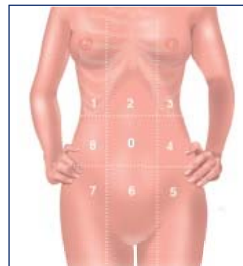
9 quadrants abdomino-pelviens numérotés de 0 à 8 dans le sens des aiguilles d'une montre en partant de la zone contenant le nombril